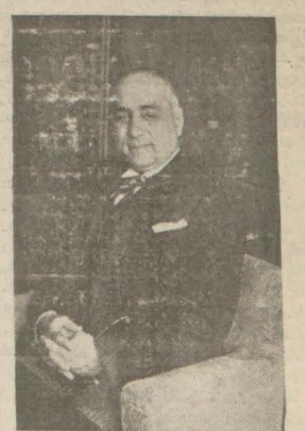
Adliye Vekili Hasan Menemencioğlu

Ankara, 14 (Hususi) — Millî korunma kanunu mucibince bu kanunda yazılı suçları işleyenleri mahkeme etmek üzere kurulacak hususi mahkeme için Adliye Vekâletinde hazırlıklar bitmek üzeredir. Şimdilik İstanbul ve Zonguldak'ta ikişer mahkeme, Ankara ve İzmirde birer mahkeme kurulacaktır. Bu mahkemeler on güne kadar faaliyete geçeceklerdir. Mahkemelerin müddetumülleri ve kâtib kadroları tamamen ayrı teşkil edilmektedir.